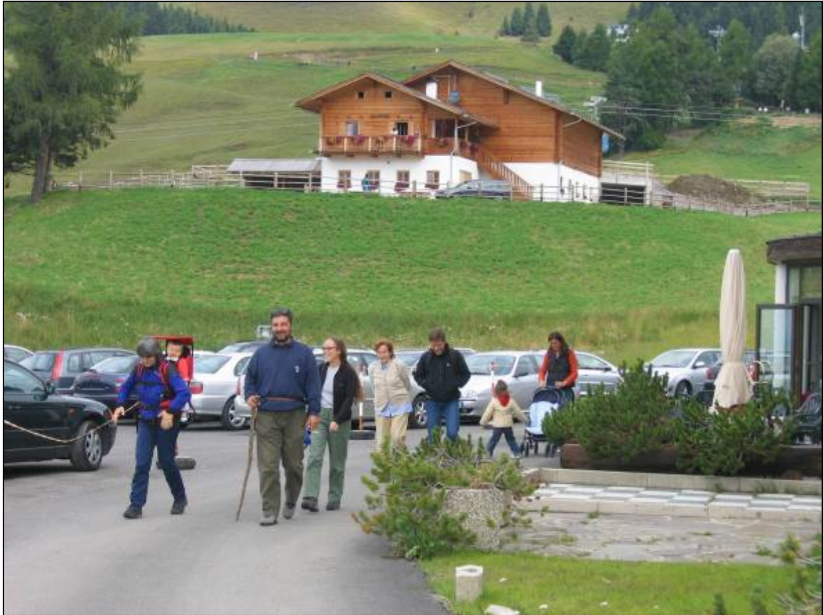
ALPE DI SIUSI. PICCOLO HOTEL.