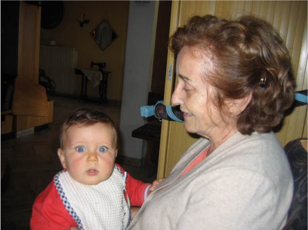
DOPO CENA LORO SALGONO IN CAMERA E VANNO A LETTO, IO STO UN PO' AL COMPUTER.