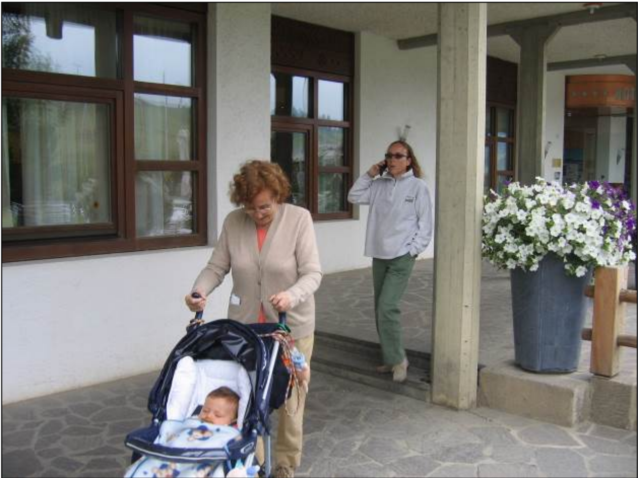
12 AGOSTO 2005 ALPE DI SIUSI